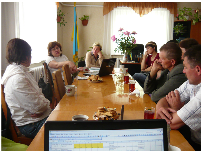
Групові консультації для активу громади с. Соколівочка Тальнівського району.