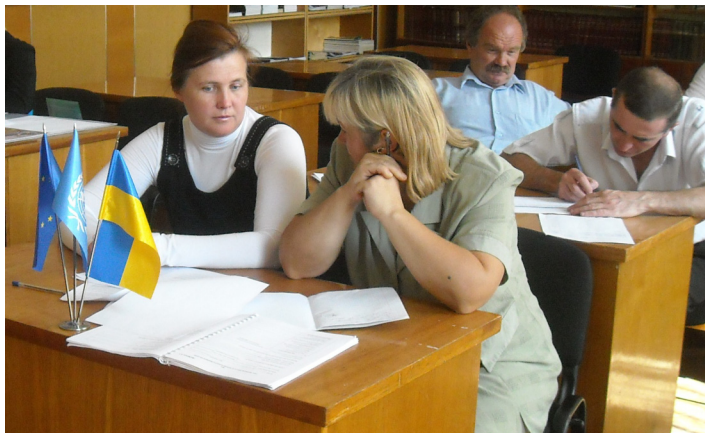
Навчальний семінар у Шполі.