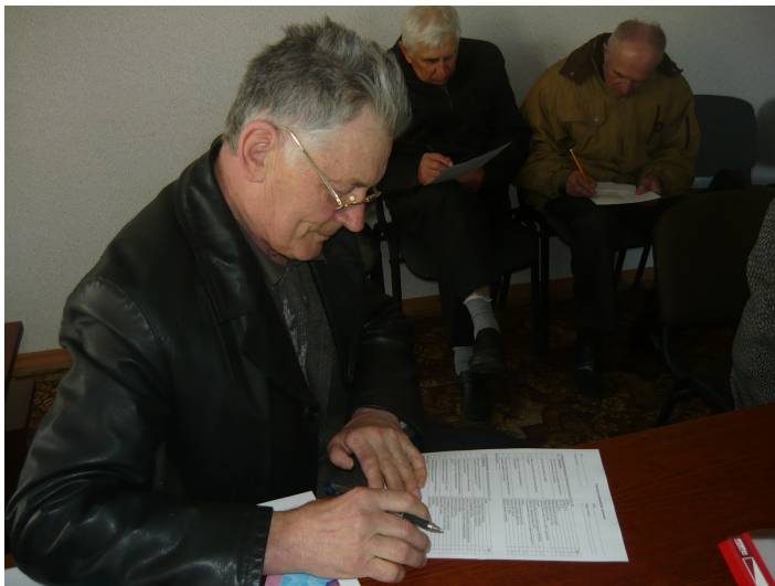
Оцінювання громади в с. Косарі Кам'янського району.