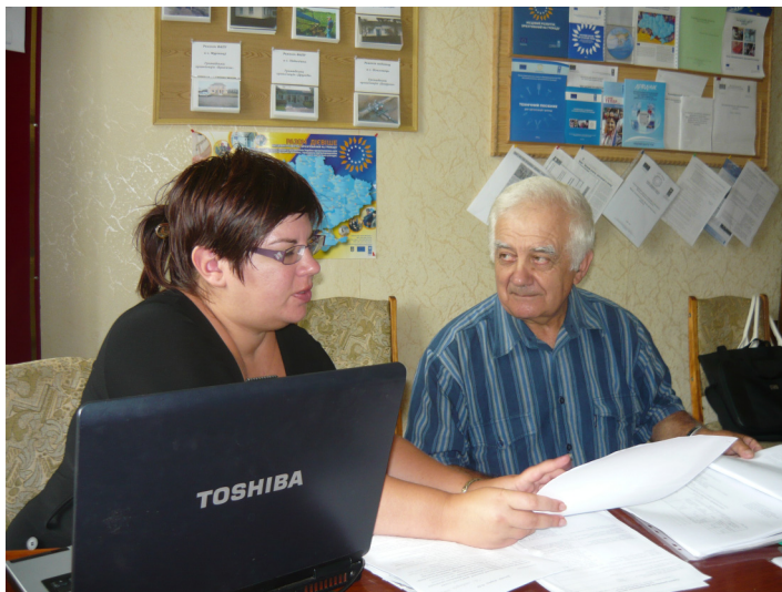
Консультації з питань розбудови громади у Звенигородському районі.