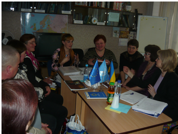
Зустріч під час моніторингової місії Європейської Комісії.