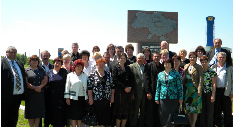
Учасники навчального візиту до Шполянського району.