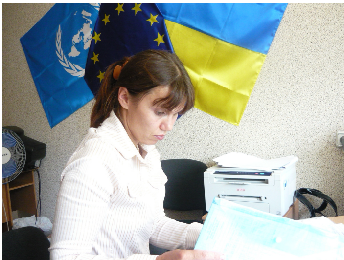
В офісі обласного ресурсного центру.