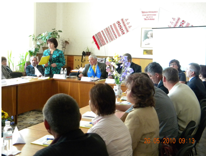
Відкрите засідання ФМР в Шполянському районі.