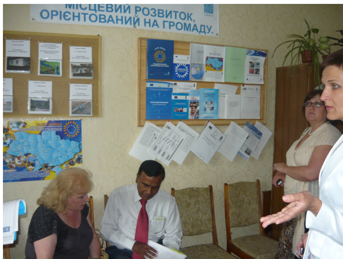
Районний ресурсний центр громади у Звенигородському районі.