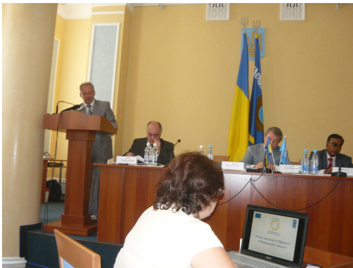
П'яте засідання обласної координаційної ради.