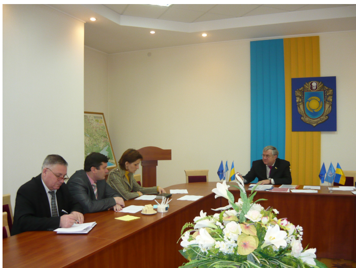
Засідання обласної комісії з відбору районів