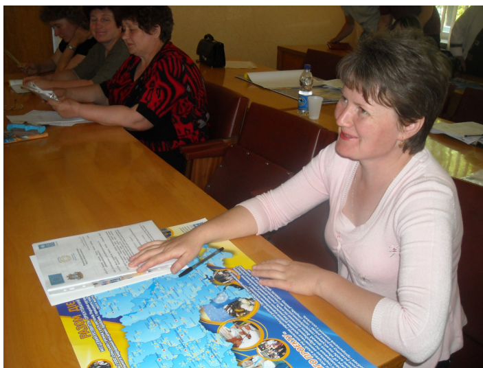
Засідання Форуму місцевого розвитку у Звенигородському районі.