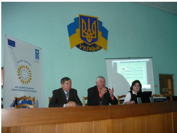
Презентація проекту у Шполі.