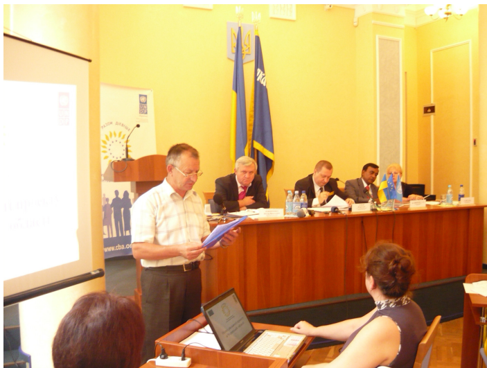
Засідання обласної координаційної ради.