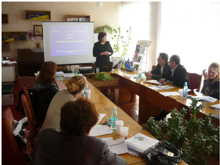
Тренінг «Спільне планування» у Городищенському районі.