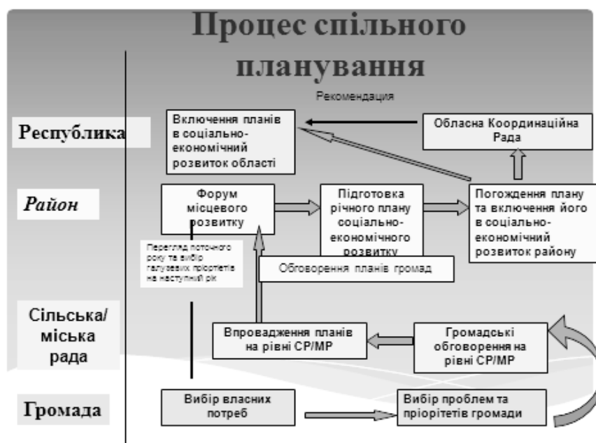
Схема 1. Планування знизу – догори

З метою спільного прийняття рішень запроваджено практику проведення форумів місцевого розвитку. На Закарпатті у кожному з дев'яти пілотних районів форуми засновані розпорядженням голів райдержадміністрацій або спільним рішенням з головами районних рад.