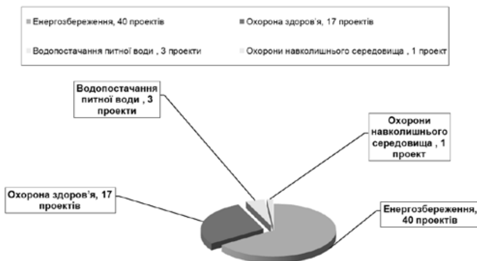
Діаграма 2: Розподіл мікропроектних пропозицій за пріоритетами

Загальна кількість ініціатив по енергозбереженню – 40, з них вуличне освітлення - 15, дитячі садки – 22, школи – 2, центри громад -1.