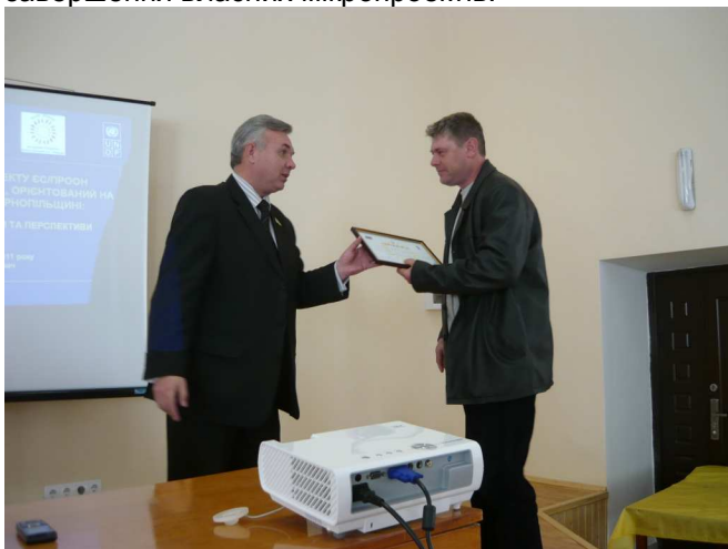
На фото: під час проведення ФМР в Буцацькому районі.

Окремі голови громадських організацій отримали на засіданнях ФМР сертифікати про успішне завершення власних мікропроектів.