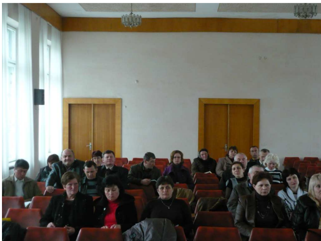
На фото: учасники ФМР в Тербовлянському районі.

Під час проведення засідань Форумів представники громад разом з керівництвом районів, представниками районних служб та Проекту МРГ обговорили всі проблемні питання, які виникали в ході впровадження місцевих ініціатив.