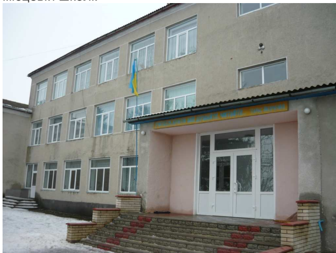
На фото; Увислівська ЗОШ після ремонту.

Спочатку увислівчани відремонтували відремонтували місцеву амбулаторію, а отримавши додатковий проект, замінили вікна та двері в місцевій школі.