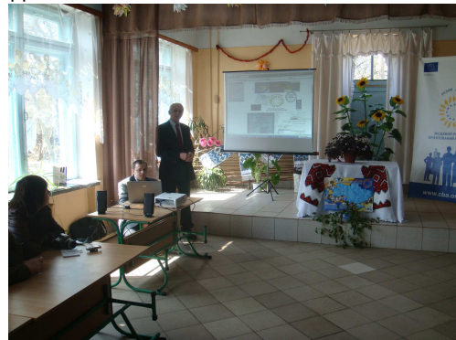
На фото: активісти ГО на зборах презентують сайт.