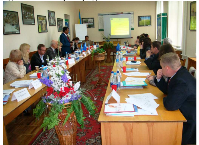
На фото: учасники круглого столу за роботою.

Під час засідання круглого столу були обговорені питання налагодження співпраці між вузами та ПРООН стосовно впровадження принципів сталого розвитку, вироблені рекомендації та умови підписання майбутніх угод.