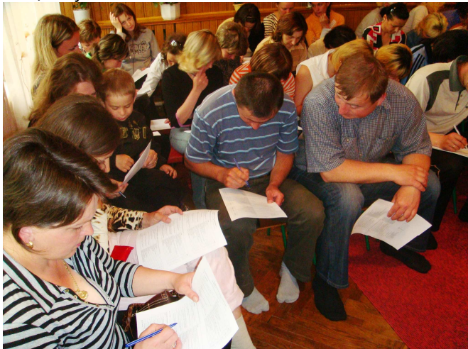
На фото: члени ГО «Сонечко» (сmt.Козова) проводять оцінювання.

Вже другі угоди з ПРООН підписали успішні громади з Великого Говилова, Козови, Підволочиська, які також оцінювали свою діяльність на цьому етапі.