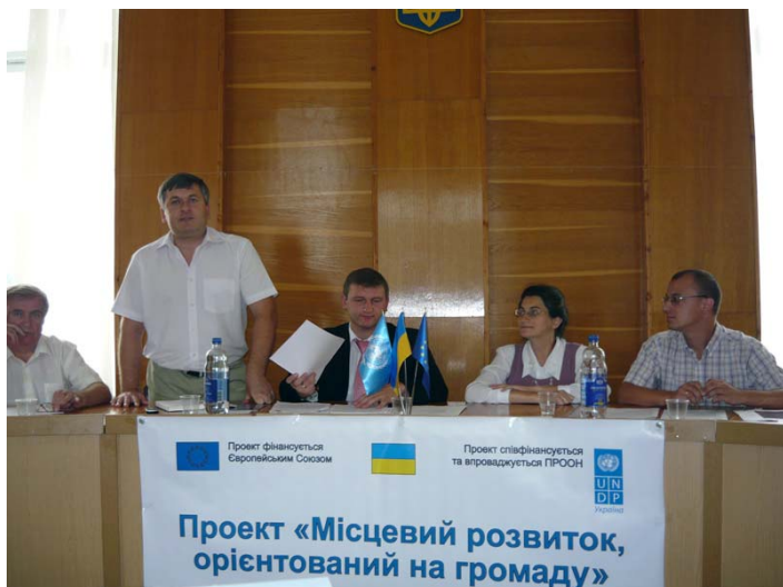
Районні семінари в Городку і Красиліві.