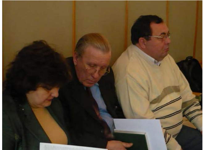
Обговорення ініціатив громад Тростянецького району 11 грудня 2008 року

Одним із основних позитивів проведення засідань форумів місцевого розвитку у районах є те, що вони були зініційовані самими громадами під час проведення перших діалогів. Оскільки фінансування мікропроектів громад проходить за принципом 50% (але не більше $10,0 тис.) від суми вартості проекту – співфінансування від Програми розвитку ООН в Україні, 45 %- кошти різних рівнів бюджетів і залучені кошти з різних джерел та не менше 5% - кошти громади, то основним питанням, на яке бажали знайти відповідь представники громад, стало питання можливості співфінансування мікропроектів громад районною владою.