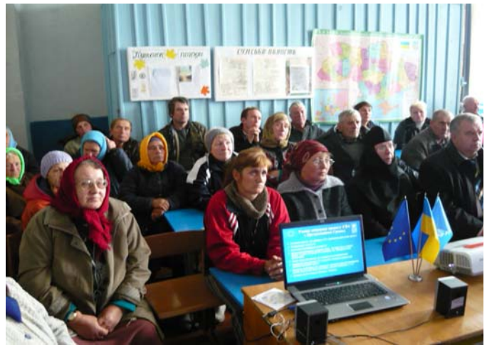
Перший діалог з громадою с. Журавне Чернеччинської сільської ради Охтирського району