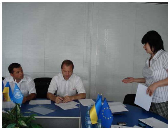
Роз'яснення критеріїв відбору сільських та селищних рад керівництву райдержадміністрацій та міськвиконкомів м. Суми, 19 серпня 2008 року

Великописарівський район: Тарасівська, Вільненська, Яблучненська сільські ради, Кириківська та Великописарівська селищні ради. Ще 3 ради визначені як резервні: Катанська, Іванівська та Добрянська