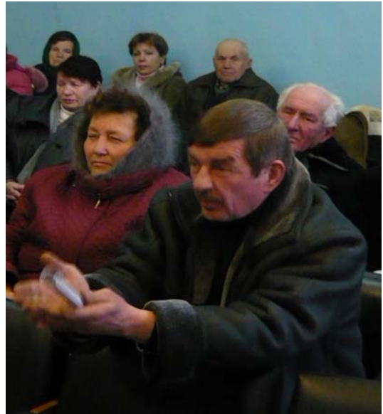
Під час проведення першого діалогу в громаді смт. Кириківка Великописарівського району

Так, на перший діалог у смт. Кириківка Великописарівського району зібралися представники домогосподарств декількох вулиць селища. Проблема, над якою хочуть згуртувати свої зусилля мешканці – якість питної води. Як показала зустріч, до сьогодні водогони або будувалися, або реконструювалися, коли назрівала критична ситуація з доступом до питної води. Ремонт існуючих водомереж потребує значних коштів, і ні селищна рада, ні громада самотужки це питання вирішити не в змозі.