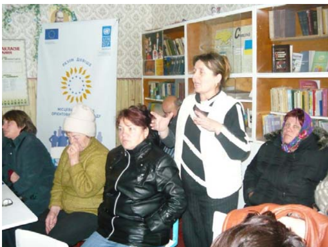
Громада с.Олександрівка обговорює проблеми та шляхи їх вирішення

Громада с. Олександрівка (Доманівського району) на зборх підняла та обговорила чимало актуальних проблем. Яку з проблем обрати для вирішення і чи зможе громада справитись із завданнями проекту? Учасники зборів жваво вирішували, яку проблему обзначити як найважливішу для вирішення і під неї готувати проектну пропозицію ля фінансування Проектом «Місцевий розвиток» (50%) та місцевим бюджетом (45%). Ще 5% має зібрати сама громада. Громада вирішила також приділяти більше уваги догляду за спільною власністю, не лише кожен за своїм подвір'ям чи домом.