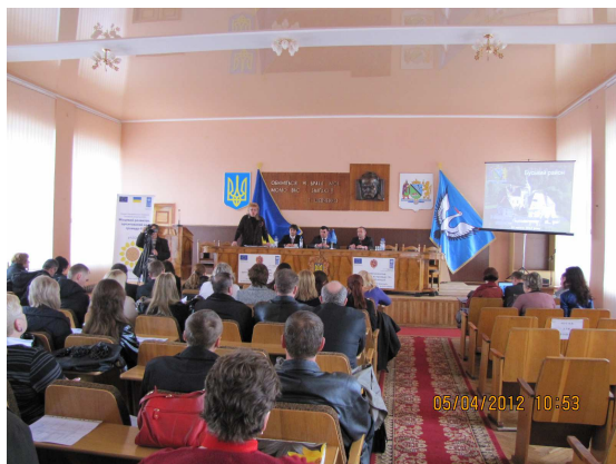
На фото: Підведення підсумків тренінгу (актова зала Буської РДА)

Обговорено проблематику ресурсних центрів громад та районів. В процесі тренінгу здійснено візит в с. Заводське Буського району, де проведено зустріч з активом ОГ, оглянуто об'єкти, які були освоєні в першій фазі проекту. Проведено зустріч в Буському районному ресурсному центрі громад. Зроблено підсумки тренінгу, в режимі питання-відповіді відбувся обмін думками серед учасників тренінгу.