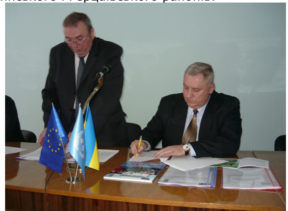
На фото: угоду про співпрацю підписують керівники Хотинського району

Правовою основою для спільної діяльності по відтворенню методології МРГ стало підписання в ході семінарів угод між керівництвом ПРООН та очільниками районних рад та райдержадміністрацій Хотинського і Герцаївського районів.