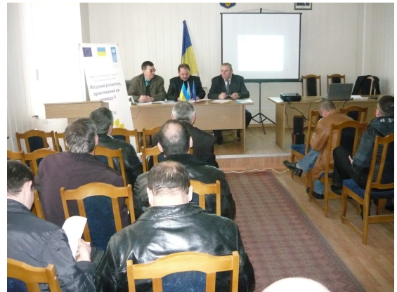
На фото: учасники семінару в Герцаївському районі

Під час даних заходів лідери органів місцевого самоврядування та керівники районних органів влади знайомилися з ходом реалізації першої та другої фаз Проекту «Місцевий розвиток, орієнтований на громаду», вивчали суть самого процесу відтворення методології місцевого розвитку.