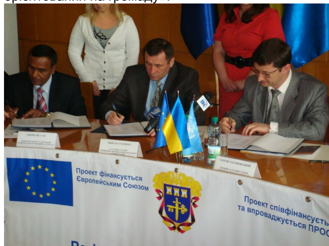
На фото: під час підписання угоди.

Завершилось проведення семінару підписанням трьохсторонньої угоди про співпрацю між Тернопільською облдержадміністрацією, обласною радою і ПРООН про співпрацю в реалізації другої фази Проекту «Місцевий розвиток, орієнтований на громаду».