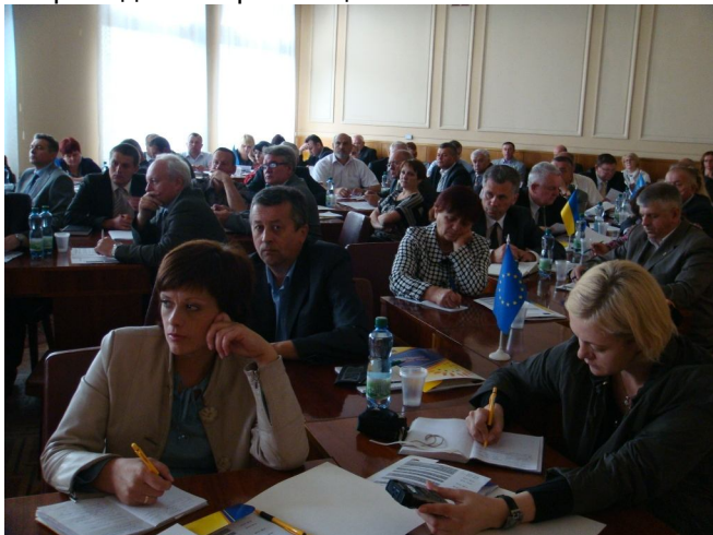
На фото: під час проведення семінару