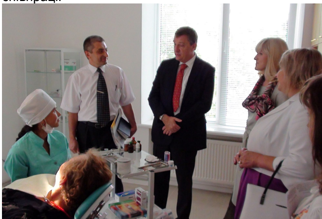
На фото: під час відвідання амбулаторії в с.Увисла

Гості зустрілись з представниками громадської організації «Добробут», яка впроваджувала ці ініціативи, керівництвом району і сільської ради. Під час відвідання амбулаторії присутні також ознайомилися з роботою на базі відремонтованої амбулаторії навчально-практичного центру первинної медико-санітарної допомоги, створеного Тернопільським медичним університетом відповідно до угоди із сільською радою. п.Олів'є Адам з цікавістю оглянув матеріальну базу амбулаторії та навчального центру, створену спільними зусиллями міжнародних донорів, влади, громади на вузу, поспілкувався із пацієнтами з числа місцевих мешканців та представниками медуніверситету і відмітив унікальність та корисність подібної співпраці.