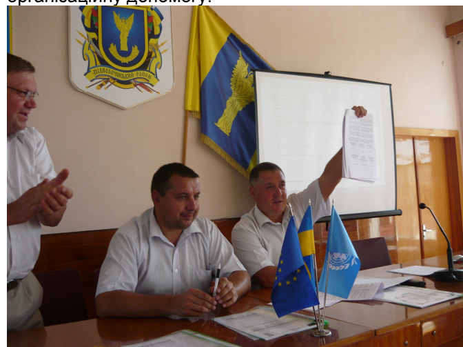
На фото: угоду про співпрацю підписано у Підволочиську

У кожному районі в кінці семінару голови райдержадміністрацій та районних рад підписали угоди про співпрацю з Програмою розвитку ООН, в яких вони підтверджували своє бажання взяти участь в Проекті та виконувати умови міжнародних донорів. Для представників громад в цих угодах головне те, що вони не залишаться наодинці із всіма труднощами в процесі впровадження власних ініціатив а отримають від влади фінансову та організаційну допомогу.