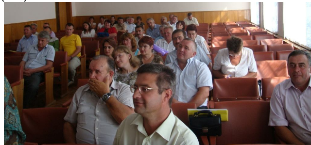
На фото: під час проведення семінару в Козівському районі

Проектом буде відібрано по 4 сільських ради, на території яких визначаються також 4 конкретні громади окремих населених пунктів для фінансування. Мікро-проекти громад будуть співфінансуватись Проектом (50%, до $10.000), місцевим бюджетом (від 45%) та самою громадою (5%).